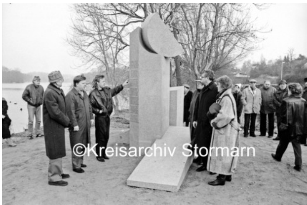
Einweihung der Skulptur am Reinfelder Herrenteich, 1990

In vielen deutschen Städten und Gemeinden wurden nach dem Dichter Straßen, Plätze und Gebäude benannt. U. a. tragen in Reinfeld die evangelische Kirche und die Grundschule, in Hamburg-Wandsbek ein Gymnasium sowie in Reinfeld und Reinbek jeweils eine Straße seinen Namen.